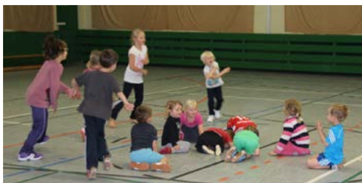
Fang- und Laufspiele, wie hier „Dracula-Ticker“, kommen bei den Kindern immer gut an und fördern Koordination und Ausdauer.