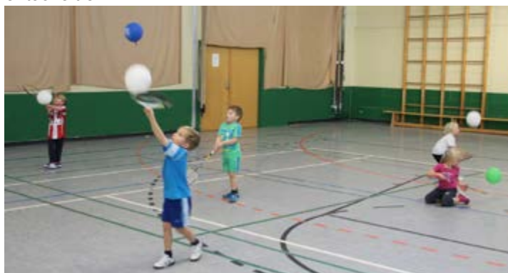
Dies sind Teilnehmer der Ballfrühförderung, die mit Badminton- bzw. Tennisschlägern einen Luftballon in der Luft halten.

Auf den Tennisplätzen des SSV fand in 2014 der 1. Ostsee Cup statt, der bei seiner Premierveranstaltung gleich zum größten Turnier in Schleswig-Holstein wurde. Im kommenden Jahr findet das Turnier vom 24.-26.7.2015 statt. Es richtet sich an Turnierspieler und Hobbyspieler gleichermaßen. Direkt davor (20.-24.7.) findet ein Tennis & Surf Camp statt, welches sich an Tennisinteressierte von 6-88 Jahren richtet. Das Camp ist auch geeignet, um einmal den Tennissport intensiv kennen zu lernen, um sich dann für den Sport zu entscheiden.