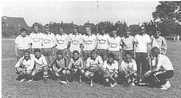
Meisterteam 1984 / 1985