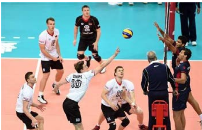
Platz 3 bei der Herren WM 2014 für Deutschland!