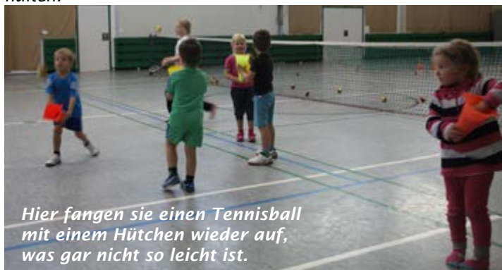
Hier fangen sie einen Tennisball mit einem Hütchen wieder auf, was gar nicht so leicht ist.