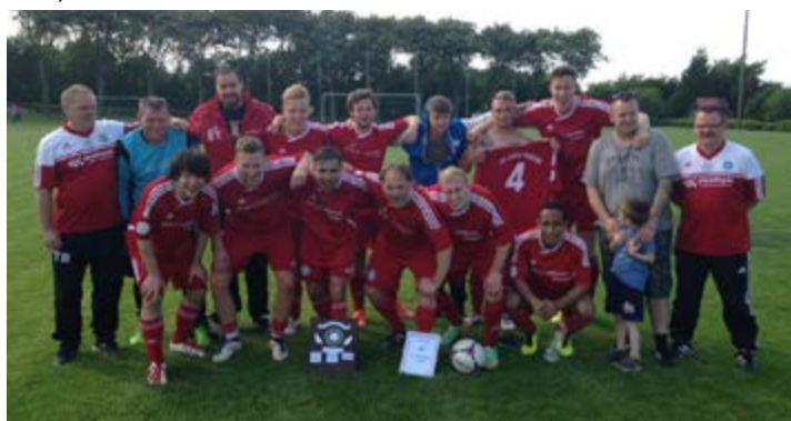
Meister B-Klasse 2014