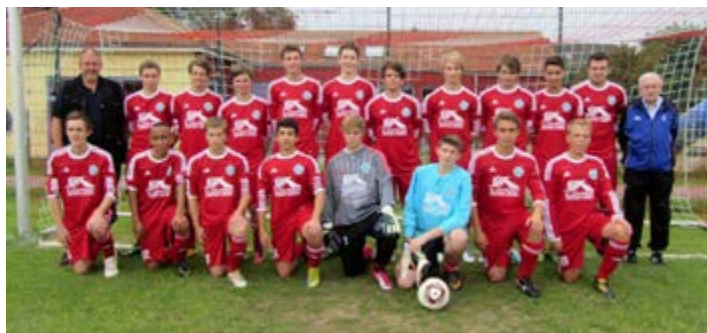
A-Jugend Meister 2012