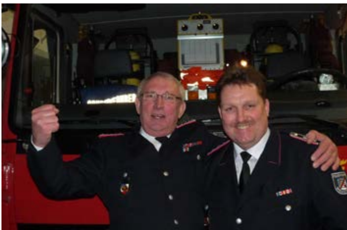
Der „alte“ und der neue Gerätewart

Im Juli kam es zu einem Alarm im Feldbarg: Nachbarn hörten einen Rauchmelder, die Bewohner sind nicht zuhause was nun? Richtig: die Feuerwehr rufen über den Notruf 112. Nach Eintreffen der FF Wendtorf wurde der Rauchmelder lokalisiert und es konnte Entwarnung gegeben werden, da kein Rauch zu erkennen war. Nach Eintreffen des Eigentümers wurde das Haus noch von innen kontrolliert und die Einsatzstelle übergeben. Die Batterie des Rauchmelders war leer..... Mitalarmiert wurden durch die Leitstelle die Feuerwehren aus Stein und Laboe, es waren insgesamt ca. 60 Feuerwehrkameraden mit 11 Feuerwehrfahrzeugen, der Rettungsdienst und die Polizei vor Ort. Nicht zu wenig, wenn man überlegt, es hätte ein Schadenfeuer sein können. Noch während des Einsatzes hörte man immer wieder die Frage: „Muß der den Einsatz jetzt bezahlen?“ Ganz klar: NEIN! Hilfeleistungen sind kostenlos, also scheuen Sie sich nicht, den Notruf abzusetzen, lieber einmal mehr als einmal zu spät..... und denken Sie daran: Rauchmelder retten Leben, sie müssen aber auch gewartet und gepflegt werden!